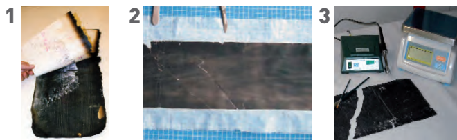
Fig. 1. Delicata fase di distacco, in ambiente umidificato, di sismogrammi sopravvissuti all'incendio di Lisbona del 1988. L'alta temperatura dell'incendio ha sciolto la lacca di fissaggio causando la creazione di pacchetti di sismogrammi incollati a due a due.